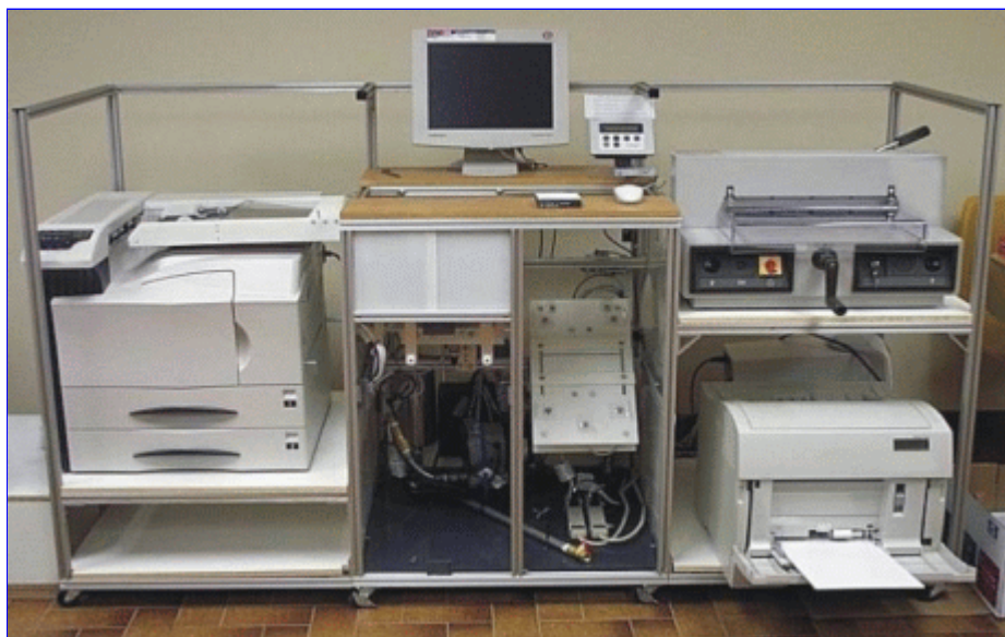
Instalace InstaBook Makeru

Zmíněné komponenty zajišťují kvalitní a výkonné zpracování, přinejmenším co se oficiálně udávaných parametrů týče: Epson 2200 je sedmibarevná tiskárna, pracující v maximálním rozlišení 2880 krát 1440 dpi, jejíž výtisky mají udávanou životnost víc jak 90 let. FS-9500 DN tiskne rychlostí 50 stránek za minutu (resp. 100 stran textu, neboť je podporován duplexní tisk) při standardním rozlišení 600 krát 600 dpi (maximum je 1800 krát 600 dpi), maximální měsíční zátěž je stanovena na 300000 stránek měsíčně. Patentovaná technologie zajišťuje podle tvrzení výrobce u dokončovacího systému podstatně větší výdrž lepené vazby než u obvyklých řešení. Systém zaujme i svými rozměry, když pro svou instalaci vyžaduje údajně pouhý jeden krychlový metr prostoru.