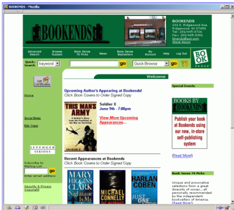
Webový portál Bookends

publikace může na přání zákazníka obsahovat jeho jméno, věnování jiné osobě apod.